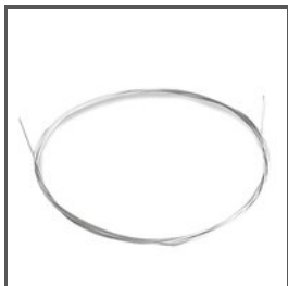
EDELSTAHLDRAHT FI-1 C24510N00