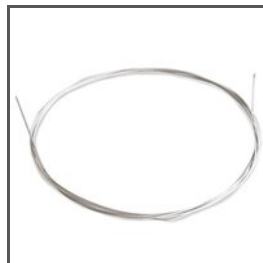
SEIL CU FI 0,95 mm Z70240